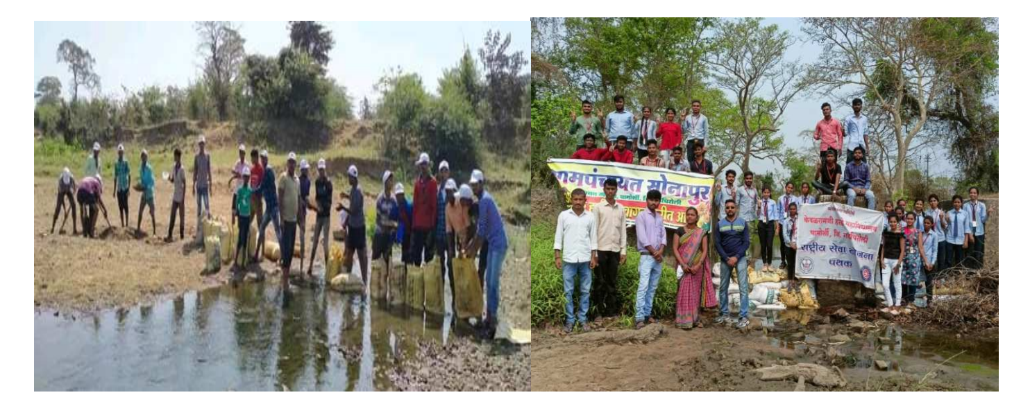
रासेयो स्वयंसेवक सोनापूर या गावी बंधारा बांधतांना To build embankment at Sonapur by the NSS Volunteers.

नेहरू युवा केंद्र गडचिरोली यांच्या संयुक्त विद्यमाने वागदरा या दत्तक गावी तेथील नाल्यावर पाणी अडविण्याकरीत बंधारा बांधण्यात आला