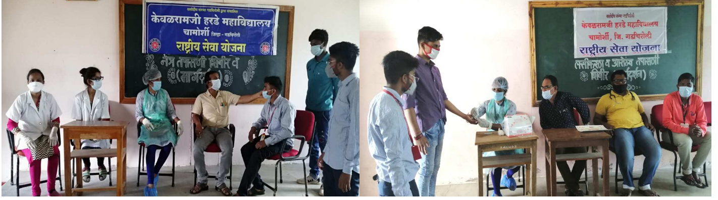
नेत्र तपासणी आणि लसीकरण व आरोग्य तपासणी करतांना