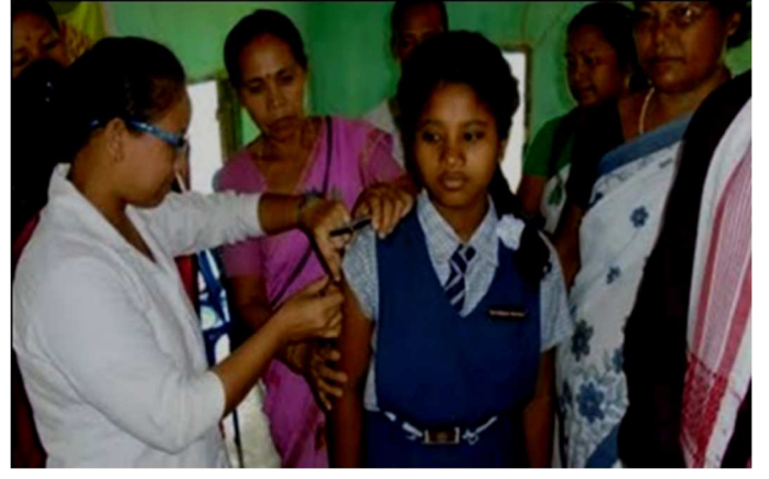
लसीकरणात मदत करतांना रासेयो स्वयंसेवक