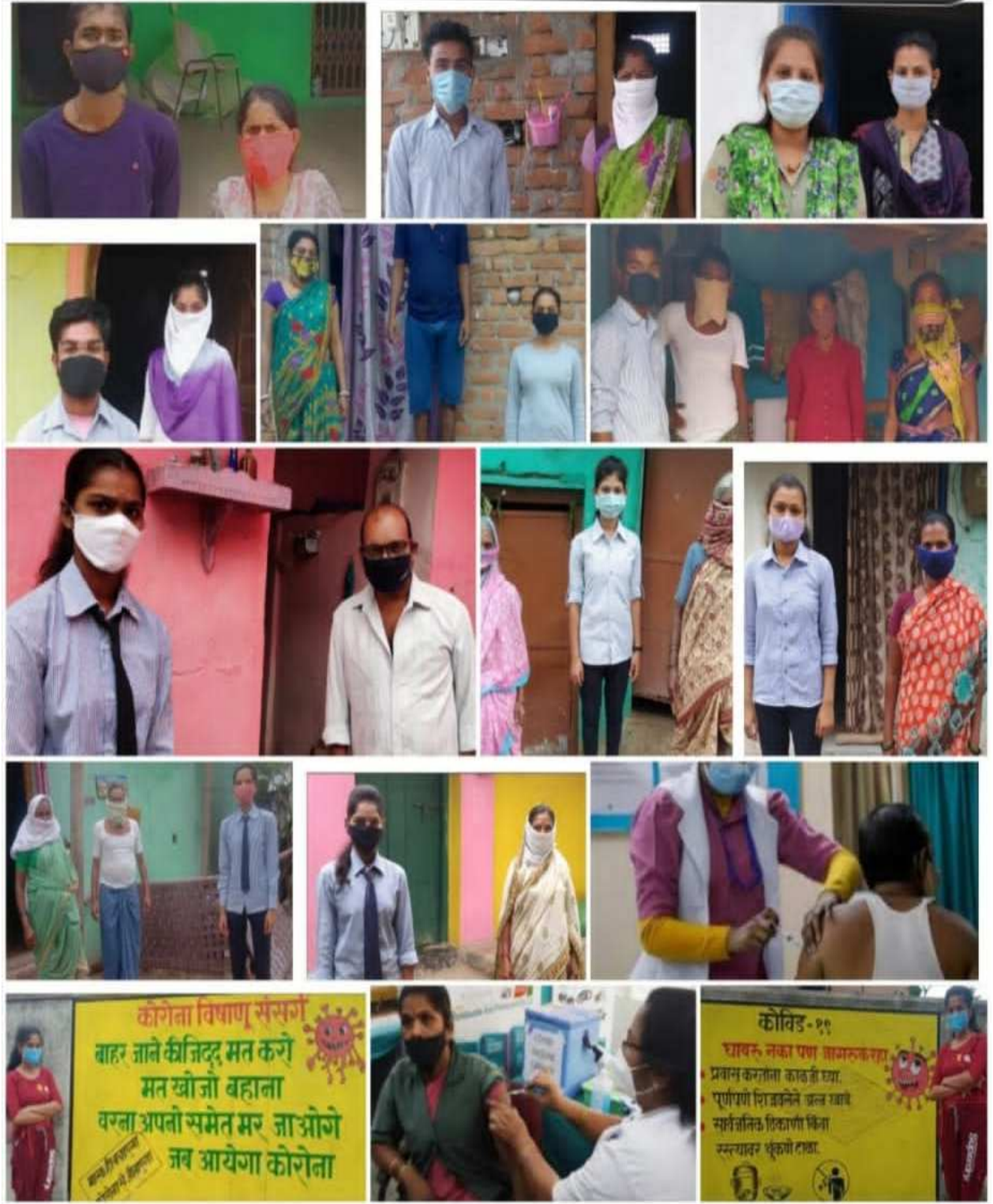
Awareness about Emphasized the Importance of Immunization

11 th April to 14 th April 2021 TIKAKARN UTSAWA” THE FORMER AND PRESENT 120 VOLUNTEERS EMPHASIZED THE IMPORTANCE OF IMMUNIZATION TO ABOUT 15000 PEOPLE.