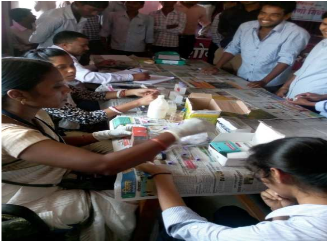
लसीकरणात मदत करतांना रासेयो स्वयंसेवक