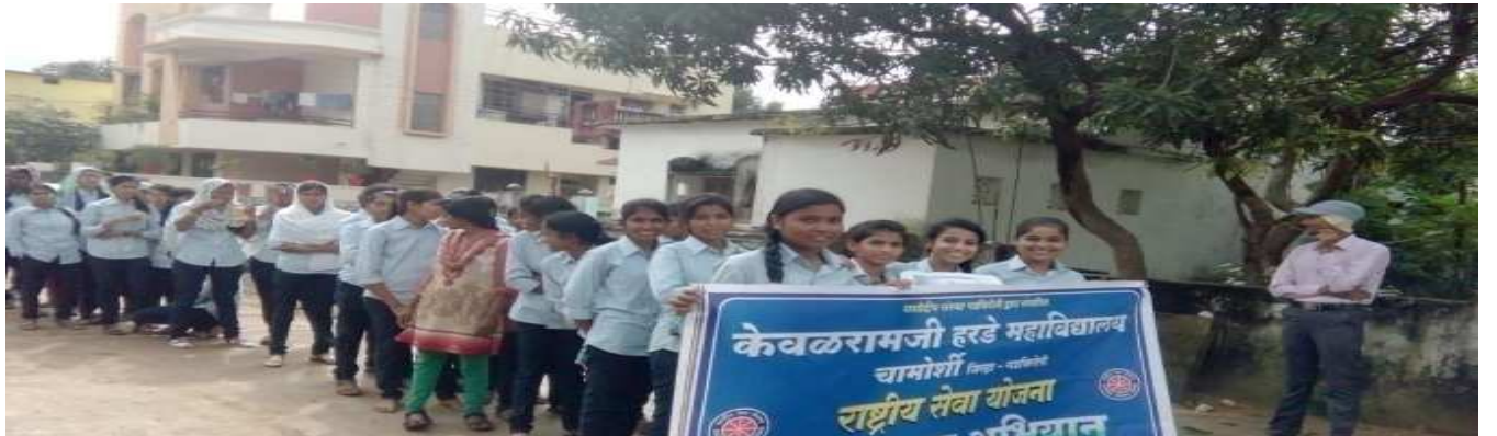
स्वस्थ शरीर, निरोगी शरीर या बाबत जन जागृती करतांना रासेयो स्वयंसेवक