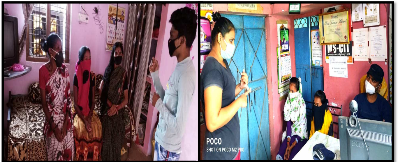
Awareness about Emphasized the Importance of Immunization