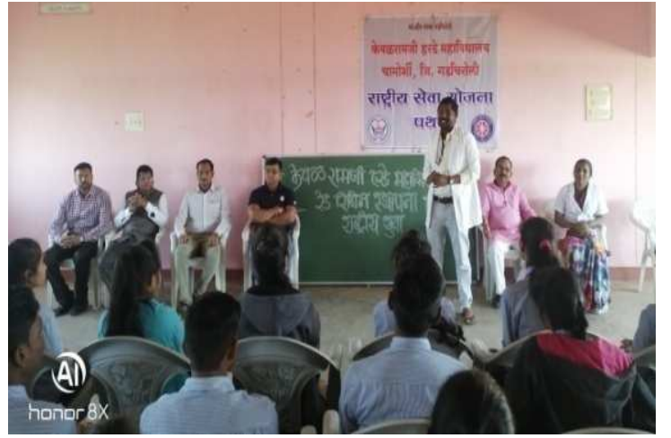
आरोग्य तपासणी शिबिरात मार्गदर्शन करतांना श्री एन. मादेशी ग्रामीण रुग्णालय चामोशी