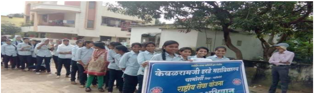
“स्वस्थ शरीर, निरोगी शरीर” या बाबत जन जागृती करतांना रासेयो स्वयंसेवक