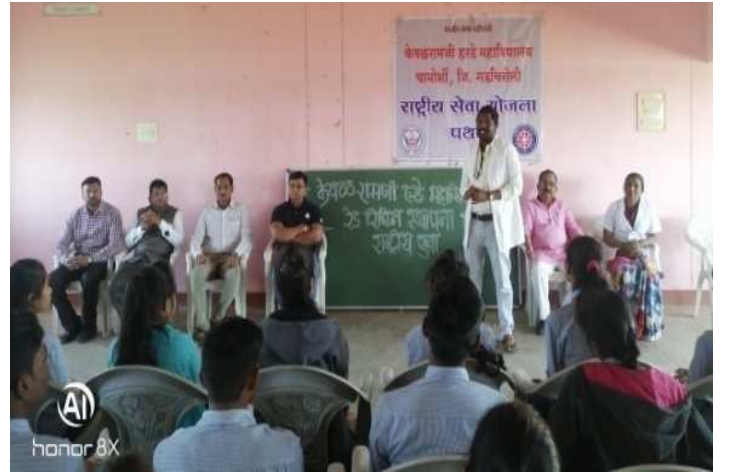
आरोग्य तपासणी शिबिरात मार्गदर्शन करतांना श्री एन. मादेशी ग्रामीण रुग्णालय चामोशी