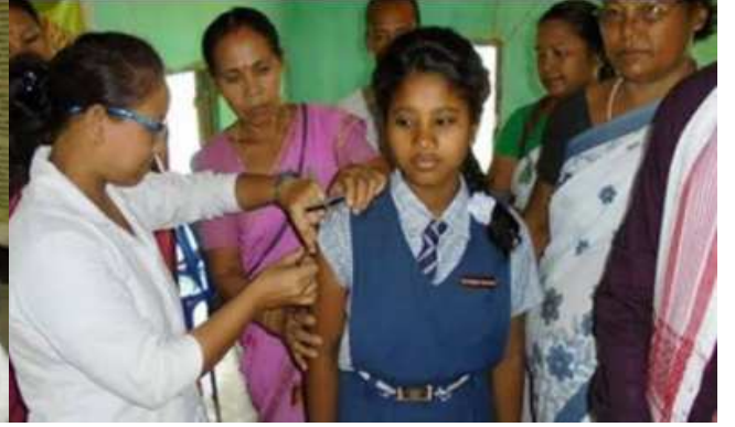
पोलियो आणि लसीकरणात मदत करतांना रासेयो स्वयंसेवक