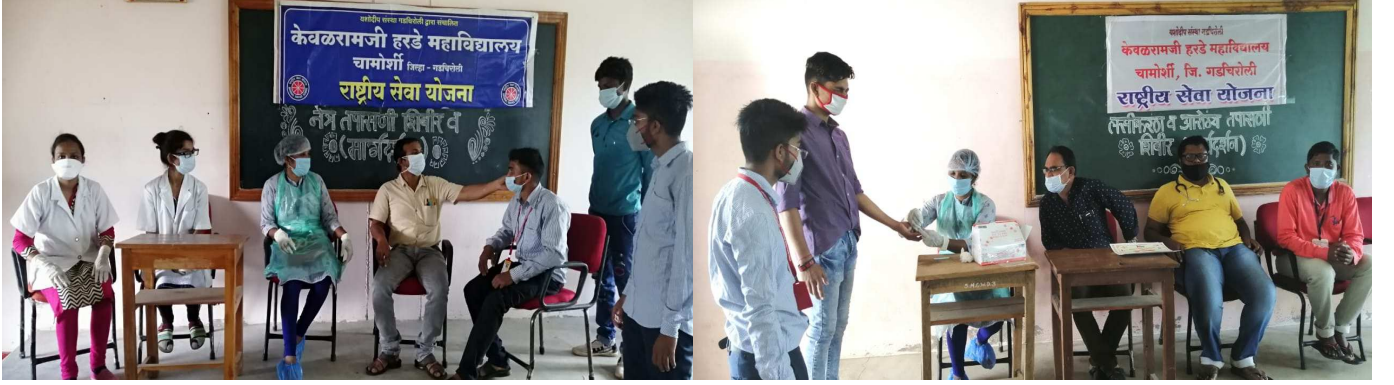
नेत्र तपासणी आणि लसीकरण व आरोग्य तपासणी करतांना