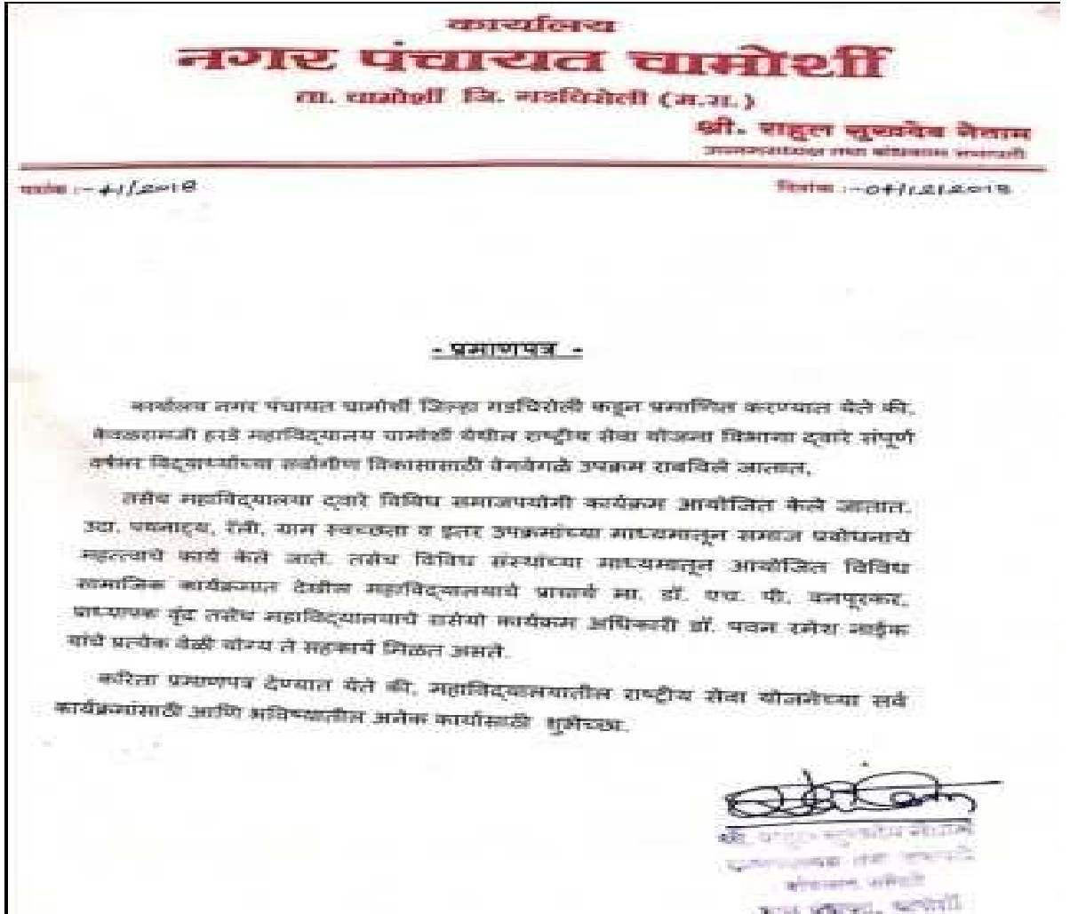
नगर पंचायत चामोर्शी द्वारे प्रमाणपत्र