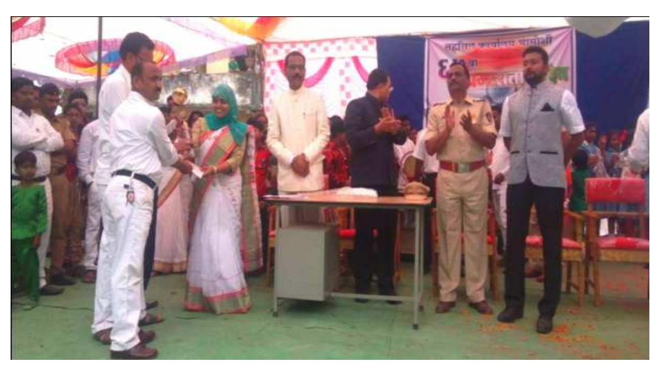
Acting as Examiner in National Voters' Day Drawing Competition, Eloquence Competition and Essay Competition organized at taluka level

Present as Examiner to evaluate the cultural program from 2017 to 2020 on the occasion of Republic Day organized by Tehsil Office Chamorshi.