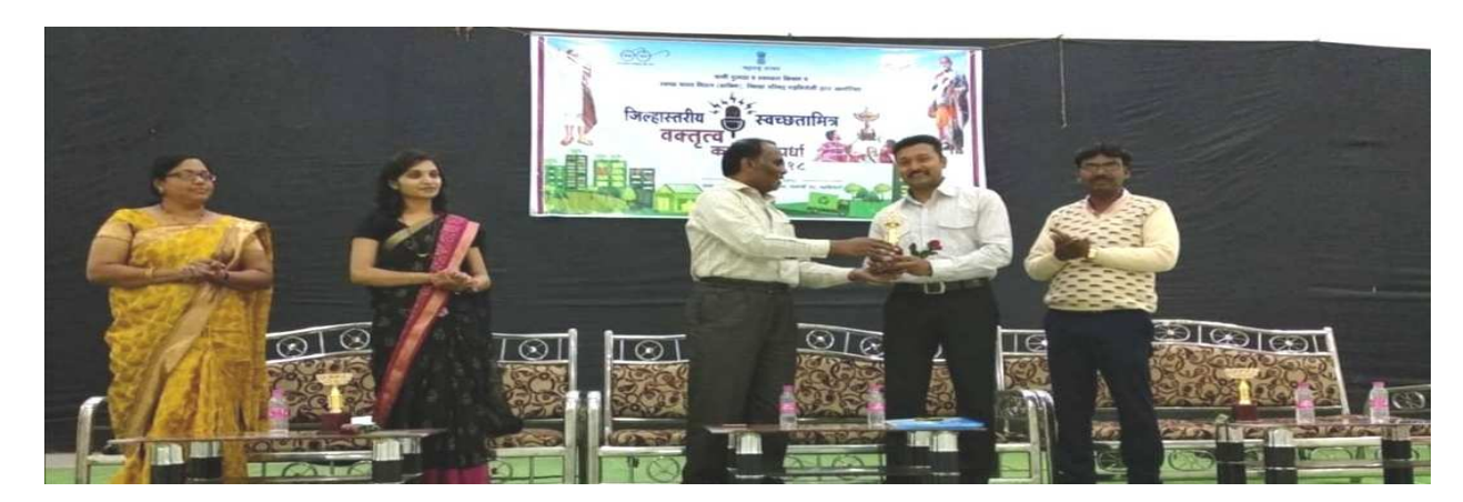
Working as Examiner for District Level Sanitation Friend Oratory Trophy Competition